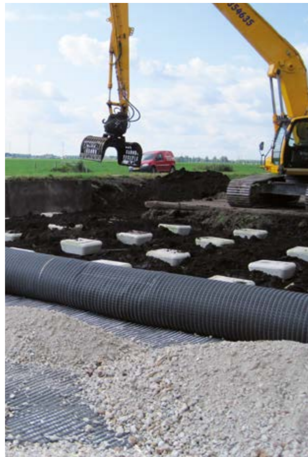
Geosintetici di rinforzo posati su pali (N210, Paesi Bassi)