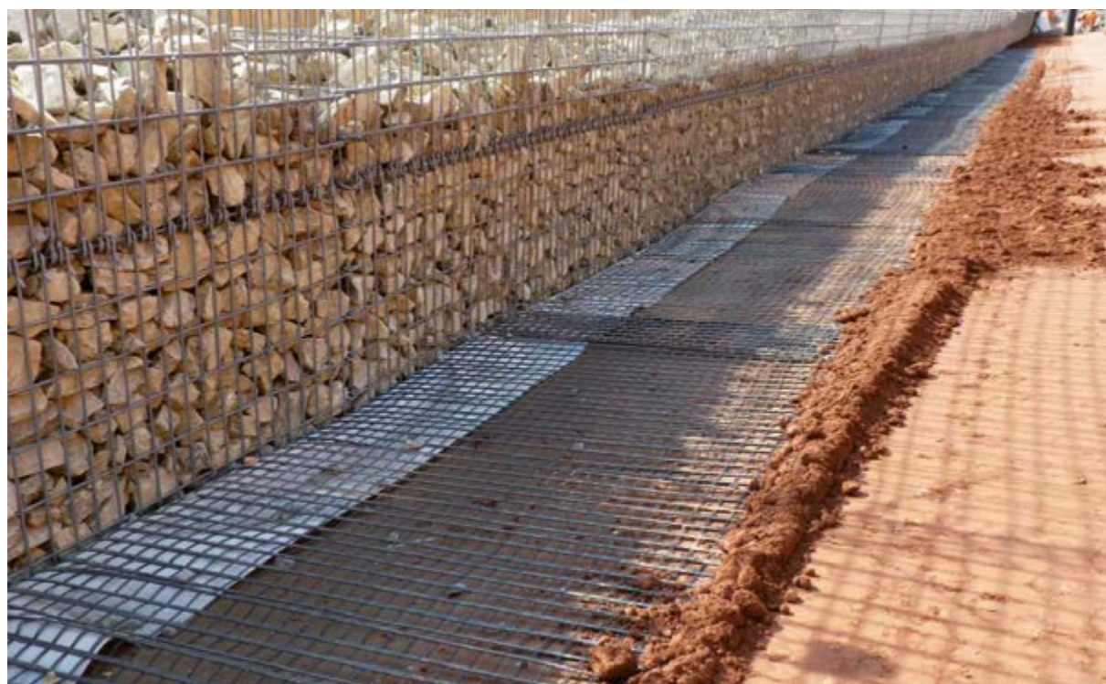
Terra rinforzata con paramento in gabbioni (Autostrada A3 nei pressi di Haseltal, Germania)