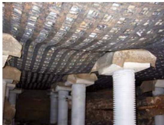
Effetto membrana della geogriglia antipunzonamento in rilevati fondati su pali (Ferrovia Bidor-Rawang, Malesia)