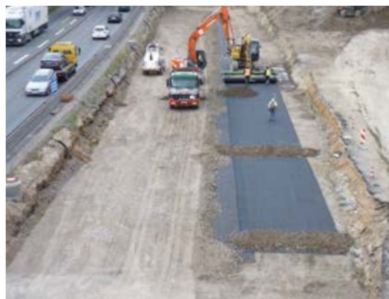
Attraversamento di cavità (Svincolo autostradale di Bochum Westkreuz (A 52), Germania)